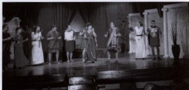
Catalans a la romana.

ca públic. Qualsevol altra interpretació és aliena a la nostra voluntat.