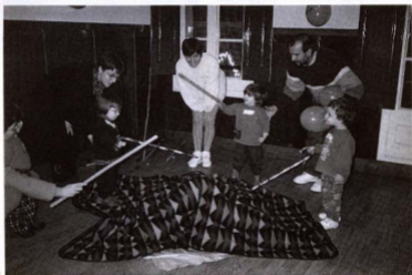
Els petits de la Casa, fent cagar el tíó