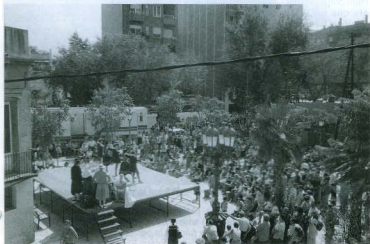
Festa Major d'Horta 1999.