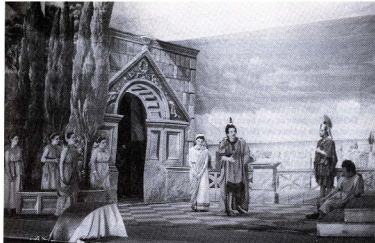
Març de 1951. Obra: Periandre .