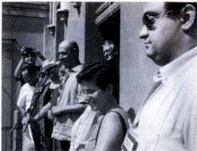
Festa Major d'Horta 1999. El pregó.

També hem fet sopars de mongetes amb botifarres, hem begut "cremat", hem engolit vermuts, ens hem ensordit amb correfocs, i no hem tingut arrossa-