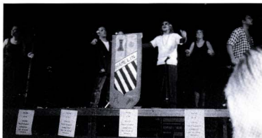
Festa Major d'Horta 1999. Teatre a la plaça Eivissa.

da ni hem vist els focs artificials perquè la senyora Pluja ens ha visitat en un mal moment.