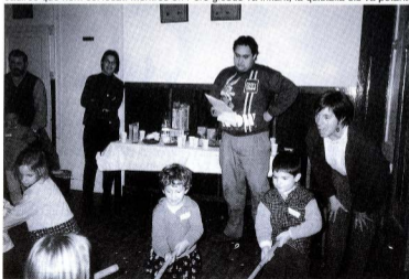
El tió.

Els menuts s'acosten al Tió per veure si ha cagat i les àvies prenen possessió de les cadires que hem col·locat. Mentre en Pere globus va inflant, la quitxalla els va petant.