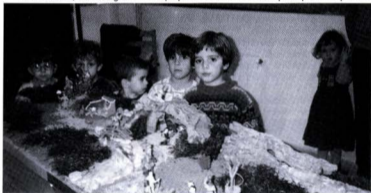
Curset de pessebres. Els més petits de tots.

Mentrestant, als més grans els expliquem les diverses tècniques que hi ha per a la