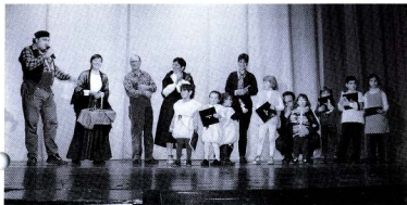
Concurs de dibuixos de Nadal.

Tot plegat ha passat prop d'una hora, i públic i actors hem gaudir daquest món meravellós del Teatre.