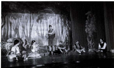
Els Petits Pastorets.