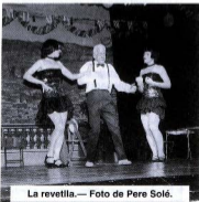
La revetlla.

L'escenari i la sala són una alegria de Revetlla de Sant Joan!