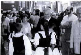
14 maig 2000.— Festa del Cor d'Horta.