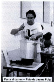
Festa al carrer.

El Grup Escènic no paren de pintar criatures i arriba l'hora que ballin els menuts de l'Esbart Folkloric, i que bonics que queden dalt de la tarima! Acabades les danses tornem a posar música. El compacte de TV3 arrasa: és l'únic que accepta l'aparell. A base d'insistir, aconseguim entrar el Rei Lleó .