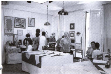
Exposició de Manualitats. Juny del 2000.