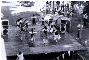
Festa al carrer.— Foto de Jaume Puig

De les Excursions fetes darrerament també en podem llegir un resum en la secció corresponent. (Pàgines 9 i 10.)