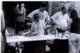
Festa al carrer.

Acabada la setmana, el diumenge dia 25, és moment de plegar veles, endreçar sales i preparar-se per al llarg descans de l'estiu.