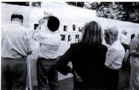
Festa al carrer.— Foto de Jaume Puig

Tota la setmana han estat força visitades les exposicions de les seccions de Manualitats i de Fotografia (per grans, joves i petits!)