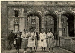
Un grupo de peregrinos ante el Castillo de Enrique IV, en Pau

— Dia calorós, per cert, i encara que són les vuit del mati, es deixa sentir de debò; a la tarda, després de dinar, fèrem una parada a Pont de Suert per tal de visitar una església famosa pel seu modernisme i bonica per cert; amunt sempre que ara ja estem a ple Pirineu, arribem al túnel de Viella, que ja el sol se'n va a posta. Quan en sortim (hem estat per travessar-lo disset minuts) és ja fosc i no ens podem adonar que estem en