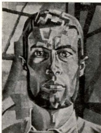
PEP SERRA - Autorretrato

precisament important perquè tot en ella és una clara línia ascendent, en la que les possibles vacil·lacions són signe positiu d'una autocrítica constructiva, i he d'insistir en què no el situo d'una manera definitiva en una obra acabada, per aquest mateix sentit crític, que l'obliga a la recerca constant, la millor cosa que es pot dir de l'autèntic artista.