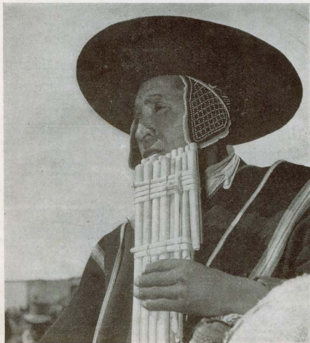
INDIO DEL ALTIPLANO ANDINO

CAMPAÑA NACIONAL DE VOCACIONES HISPANOAMERICANAS