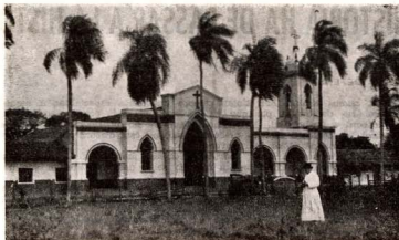
BOLIVIA. — Santa Cruz de la Sierra. Iglesia.

naristas que lo necesitan. Esta ayuda es al comienzo de 2/3 de la pensión del seminario, como norma general. Más adelantados los estudios, la ayuda es mayor. A cambio de esta ayuda, los favorecidos se comprometen a servir en una diócesis hispanoamericana durante diez años después de su ordenación y un año de ministerio en su propia diócesis.