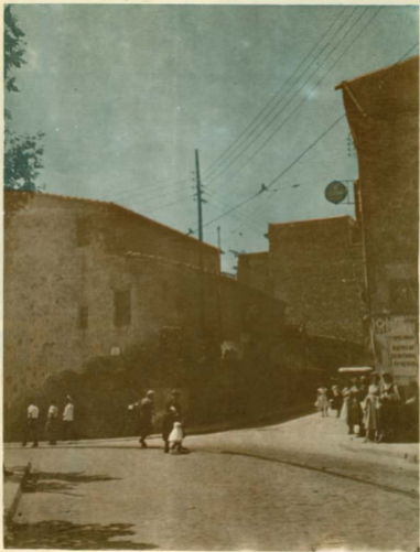
CENTENARIO BINCON, HOY DESAPARECIDO, de la PLAZA de IBIZTA