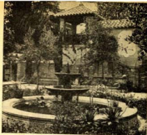
Jardines de Horto