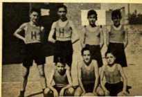
Los pequeños del C que conquistaron la gran copa

No olvides la fiesta de Cristo Rey (26 de octubre).