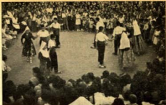
Una bella exhibició del nostre Esport Dansaire a Sant Genís dels Agudells

No cal glossar fets successis per veure la importància del folkloré. Cal dir que és fonament i complement de la història. Que no és troba més que en les tradicions, ja siguin cantades, ballades, narrades o jugades. Per tant, es pot dir que és la concepció mateixa del poble.