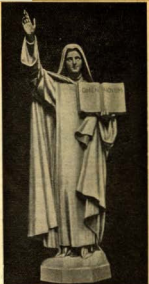
Santa Teresa del Niño Jesús, Patrona universal de las Misiones Católicas

Teresa de Lisieux, en el cincuentenario de su muerte apacible, recordará providencialmente a los hombres de hoy verdades tan sencillas, tan altas y tan oportunas.