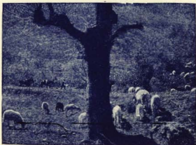
ESTAMPA DE OTOÑO