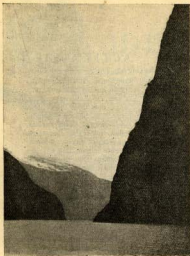
«Aigua, divins jois...»