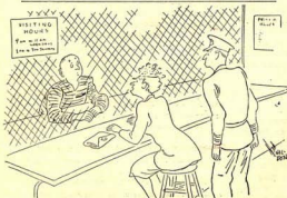
EN LA CARCEL

—Verás, papá... — respondió al cabo de unos instantes —, Lo había pensado mejor.