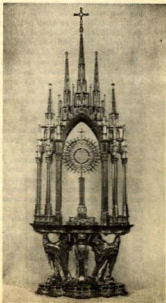
La nueva Catedral de Horta