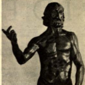
Fragmento del «San Juan Bautista» de Rodin. (Influyó en esta célebre escultura en el autor del San Juan que preside nuestro Altar Mayor?)

No ha de extrañar que la Navitas de Verano — así era felizmente designada esta fiesta en la Edad Media — haya acumulado tan excepcionales honores litúrgicos para honrar el nacimiento de aquel extraordinario varón, que gozó del uso de la razón antes de su nacimiento, que estuvo lleno del Espíritu Santo estando aún en las entrañas de su madre (Martirologio Romano), que mereció