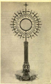
La pequeña Custodia, fragmento del monumental «tesoro» de Horta

cuyo rectorado en Horta por espacio de 26 años —hasta noviembre de 1948— ha sido pletórico en aciertos y fecunda acción apostólica.