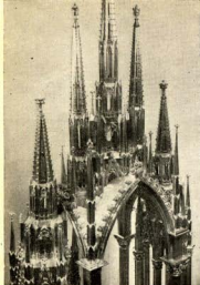
Detalle de la Custodia, que da idea de la riqueza y magnificencia de esta joya

tiende a acabar con una costumbre primitiva y excesivamente rudimentaria, puede compararse con el otro hecho, tan definitivo para la barriada de Horta, como fue el cambio del tramvia de foc por el tranvia eléctrico.