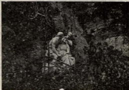
Montserrat. «Tercer Misteri de Dolor»

Con gran éxito tuvo lugar la anual Romería a Montserrat, organizada por nuestra Parroquia y como no podía ser menos fué un éxito completo. Más de 300 personas presididas por nuestro querido cura párroco se