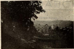
«Can Peguera», al pie del turó de La Peira, hoy desaparecida. En su lugar se levanta la barriada de San Francisco Javier.

Rica d'aigües la Vall, disposa de nombrosos fonts des de Coll-Cerola fins a Valldaura, medicinals unes i altres d'una gran potabilitat, com les de Fargas i les de Montalt. Les aigües de la Font-Roja, a l'any 1428, són ja comprades en part per la ciu-