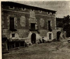
Casa «La Peiras»

No fa gaires nits... En una d'aquestes nits en què, el que no va curt de jeia, sent, sota la moixaina tèbia dels llençols, el pas gansoner de les hores negres, sense embaltiments ni oblitats eixamoradors dels problemes de la vida... Una d'aquestes nits setembrines, més aviat frescals que xafogoses, en què, per molt que hom acluqui els ulls i provi d'ensopir les falòrnies del magi desvetllat — tal vegada una taceta intempestiva de café-café;