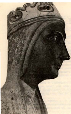
Verge de Montserrat, pregueu per nosaltres

Aquest any, ple de la presència de Maria, en què tot el món catòlic rivalitzarà per obequir la Verge Nostra Mare i rendir-li el millor tribut d'amor filial, nosaltres també volem juntar-nos a aquesta munió de fills agraïts i aportar-li la nostra ofrena, que volem sia ofrenada com a penyora de l'amor de tots. Volem poder-li dir, encara que sia plagiant un xic unes estrofes del poeta montserratí per excel·lència, Mn. Jacint Verdaguer, per tal d'adaptar-les millor a aquest treball: