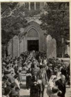
I Homenaje a la Vejez