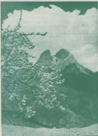
Estampa de primavera