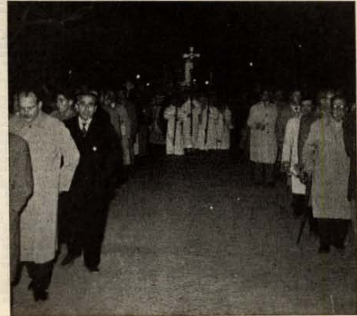
Sense témer els assots del vent, la processó fa el seu curs...

L'any 1954 se'n va!... Se'n va l'any marià, especialment dedicat a Maria! Tant de bo ens quedi del mateix la flaire de la seva puresa influint en els nostres actes i recordant-nos a cada mo-