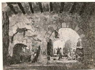
Primer premio en el XI Concurso Pesebres, obra de F. Torne

costumbre de hacer «pesebres», que no debiera faltar en ningún hogar que se precie de católico. Concurso dotado de valiosos trofeos, pueden leerse las bases en programas especiales. Para inscripciones deben dirigirse a la casa Rectoral durante las horas de despacho.