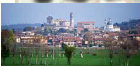
Castiglione delle Stiviere, actualment