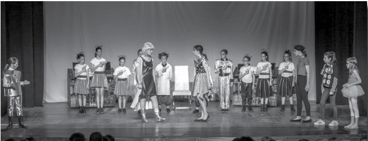
INVASIÓ A LA TERRA