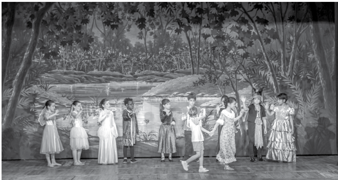
EL LLIBRE MÀGIC