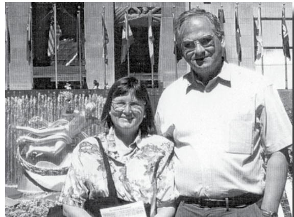
Viatge de noces d'argent Nova York (Rokefeller Center)