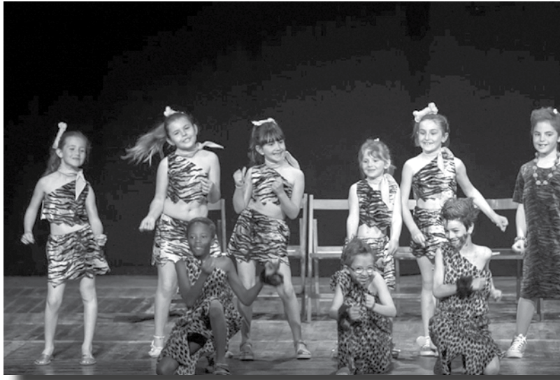
NO TENIM EL COR DE PEDRA