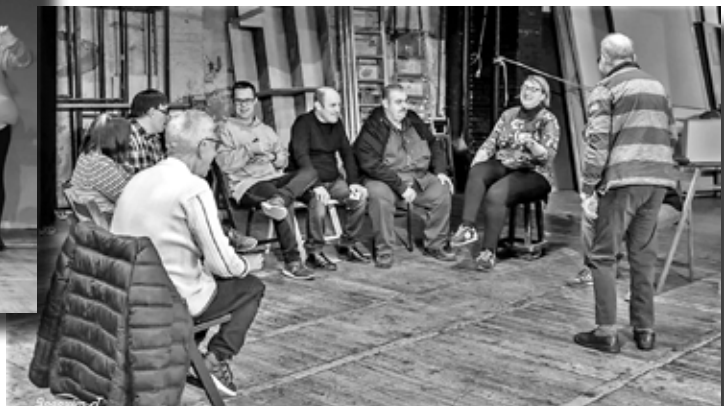
UN CASO MUY LIOSO