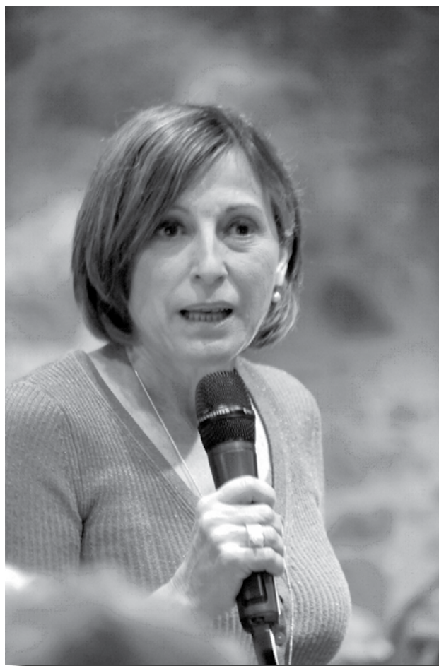
Sopar de gala 150è Aniversari de Lluïsos d'Horta Molt honorable Sra. Carme Forcadell, Presidenta del Parlament de Catalunya.

Carme Forcadell Lluís , presó Puig de les Basses, cel.la 14, dia 4 de juliol de 2018.