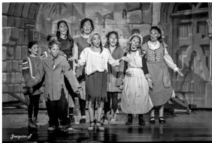
ELS BRUTS DE VALLNETA