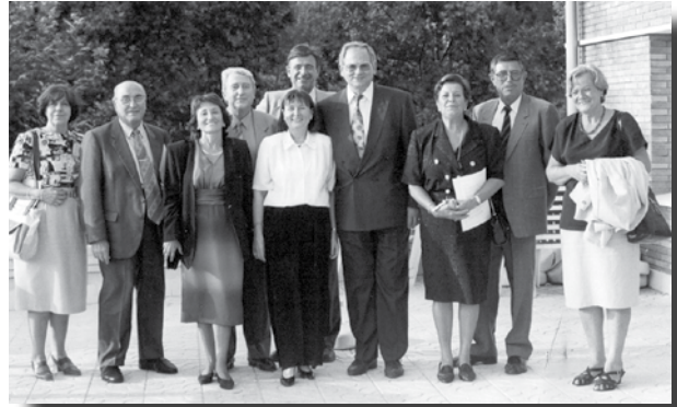
Celebració noces d'argent, els Cutxipanderos amb Mn. X. Rosselló

Antoni: Així doncs, la vostra relació actual amb els Lluïsos, quina és?