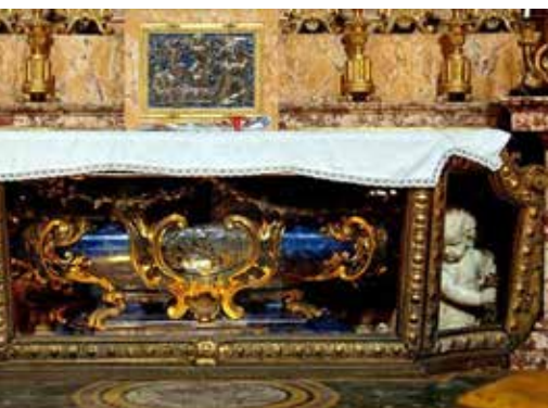
Tombeu de Sant Lluís a l'església de sant Ignasi, a Roma

A la família hi va haver un sant, Lluís Gonzaga, catorze cardenals i tretze bisbes. (De Viquipèdia)